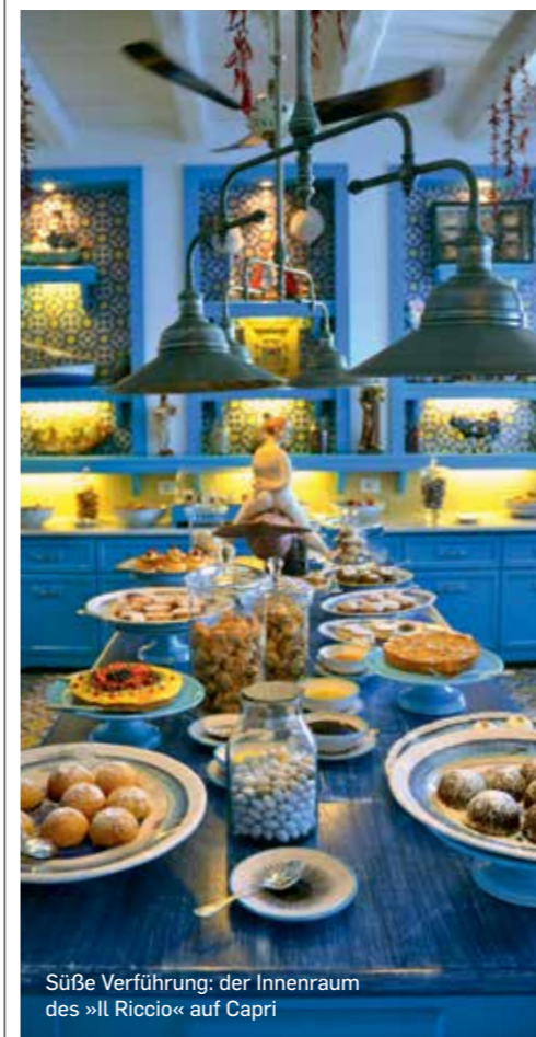
Süße Verführung: der Innenraum des »Il Riccio« auf Capri