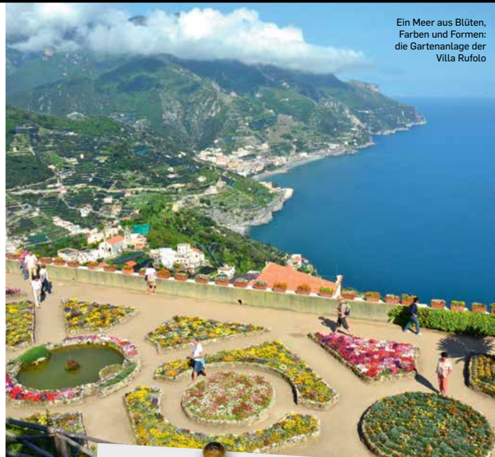
Ein Meer aus Blüten, Farben und Formen: die Gartenanlage der Villa Rufolo