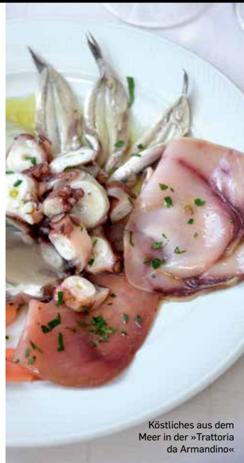
Köstliches aus dem Meer in der »Trattoria da Armandino«