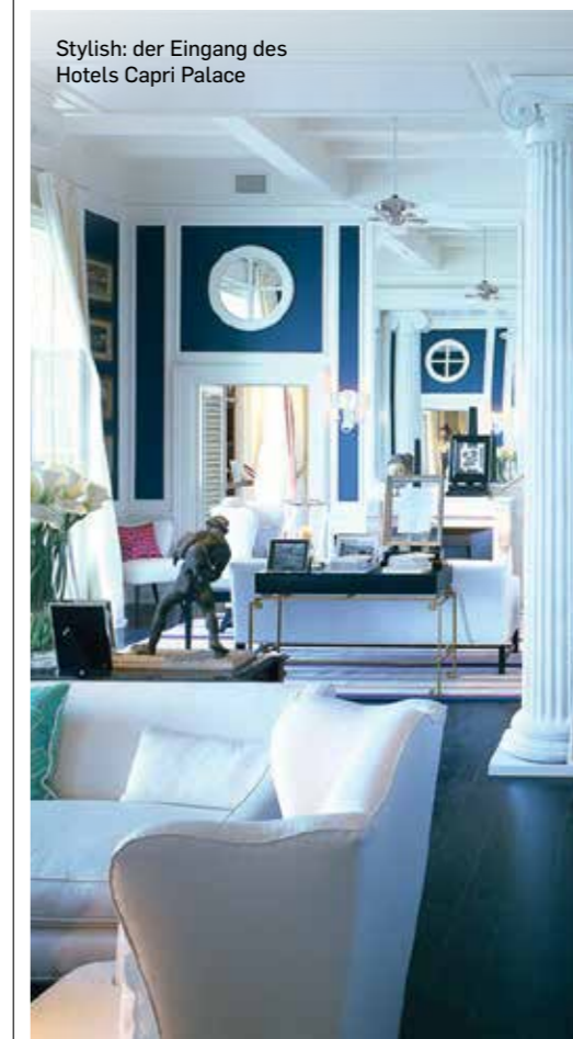
Stylish: der Eingang des Hotels Capri Palace