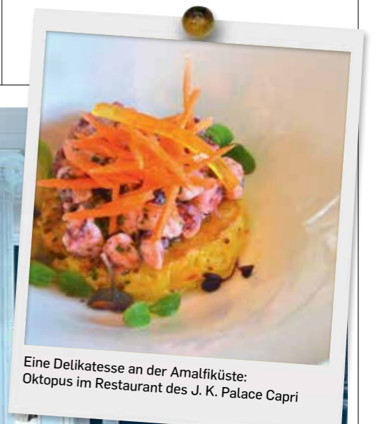
Eine Delikatesse an der Amalfiküste: Oktopus im Restaurant des J. K. Palace Capri