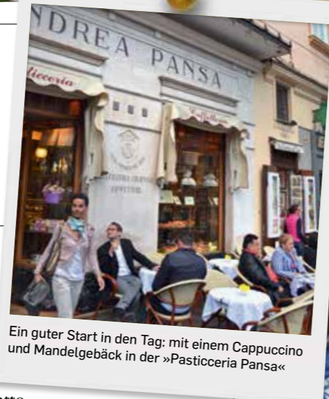
Ein guter Start in den Tag: mit einem Cappuccino und Mandelgebäck in der »Pasticceria Pansa«

Kathedrale. Zurück in Praiano führt der Weg direkt in den Hafen zur »Trattoria da Armandino«. Neben Fischern, die ihre Netze flicken, werden hier im stimmungsvollen Ambiente Köstlichkeiten aus dem Meer serviert. Bevor es am nächsten Morgen wieder zurück nach Hause geht, übernachten Sie im La Minervetta hoch über dem Golf von Neapel. Ein kleines farbenfrohes Designhotel mit vielen schönen Keramiken und einer Terrasse, die den Dolce-Vita-Spirit einfängt. Treppenstufen führen hinunter zum Hafen von Sorrent, wo man in kleinen Bars und Restaurants noch einmal Italien schmecken kann.