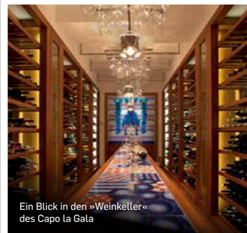
Ein Blick in den »Weinkeller« des Capo la Gala

Genussreicher Auftakt: Nach dem Lunch bei Sternekoch Danilo di Vuolo geht es ins romantisch-bunte Positano und abends in eine der besten Weinbars der Küste.