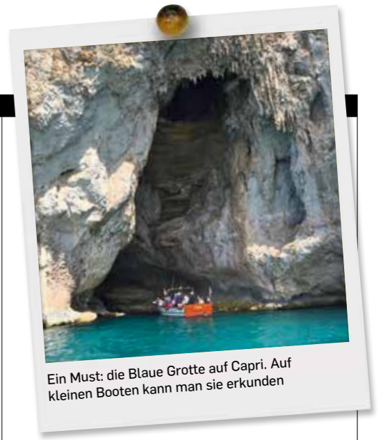
Ein Must: die Blaue Grotte auf Capri. Auf kleinen Booten kann man sie erkunden

Raus aufs Meer! Mit dem Schiff geht es nach Capri. Dort begeistern unter anderem die Piazza Umberto I., die Blaue Grotte und ein blauer Raum voller Desserts und Kuchen.