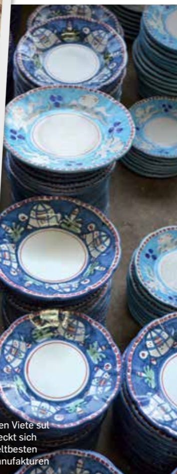
Im Städtchen Viete sul Mare versteckt sich eine der weltbesten Keramikmanufakturen

Fotos: Brigitte Jurczyk, beige stellt Illustration: Bianca Tschalkner