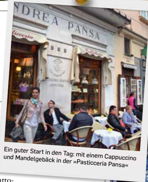
Ein guter Start in den Tag: mit einem Cappuccino und Mandelgebäck in der »Pasticceria Pansa«

Kathedrale. Zurück in Praiano führt der Weg direkt in den Hafen zur »Trattoria da Armandino«. Neben Fischern, die ihre Netze flicken, werden hier im stimmungsvollen Ambiente Köstlichkeiten aus dem Meer serviert. Bevor es am nächsten Morgen wieder zurück nach Hause geht, übernachten Sie im La Minervetta hoch über dem Golf von Neapel. Ein kleines farbenfrohes Designhotel mit vielen schönen Keramiken und einer Terrasse, die den Dolce-Vita-Spirit einfängt. Treppenstufen führen hinunter zum Hafen von Sorrent, wo man in kleinen Bars und Restaurants noch einmal Italien schmecken kann.