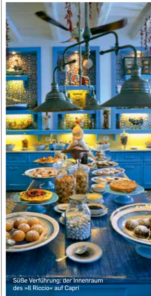
Süße Verführung: der Innenraum des »Il Riccio« auf Capri