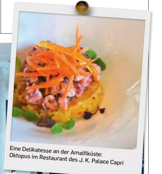
Eine Delikatesse an der Amalfiküste: Oktopus im Restaurant des J. K. Palace Capri